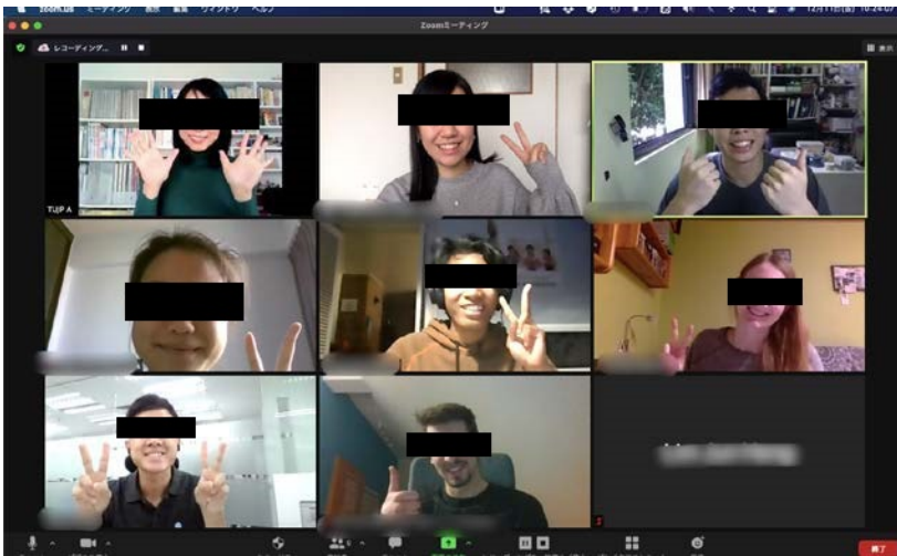
Screenshot aus einer Japanischstunde

Durch das Buddy-System, in dem jedem internationalen Studierenden ein bis zwei japanische Studierende zugeteilt wurden, war es leicht, in Kontakt mit den Einheimischen zu treten. Pro Woche sollte man sich mindestens etwa eine Stunde lang treffen. Die Studierendenorganisation @home bietet ebenfalls regelmäßig Veranstaltungen für einheimische und ausländische Studierende an.